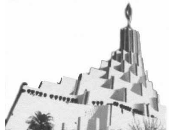
Templo Sede de “La Luz Del Mundo” en Guadalajara Jalisco, México

Porque se levantarán falsos Cristos, y falsos profetas, y harán grandes señales y prodigios, de tal manera que engañarán, si fuere posible, aun a los escogidos Mateo 24:24